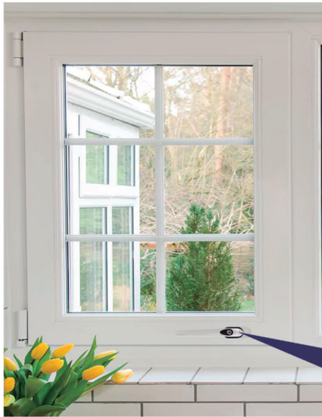
detalle en imagen